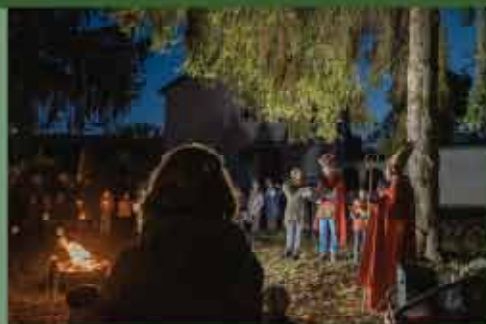
Martinszug von St. Josef und St. Matthäus mit der Blaskapelle St. Josef