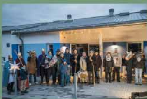
„Weihnacht unterwegs“ vor der KiTa St. Matthäus in Bischberg