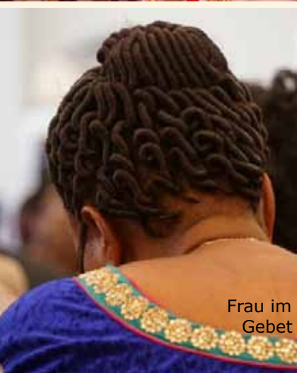
Frau im Gebet