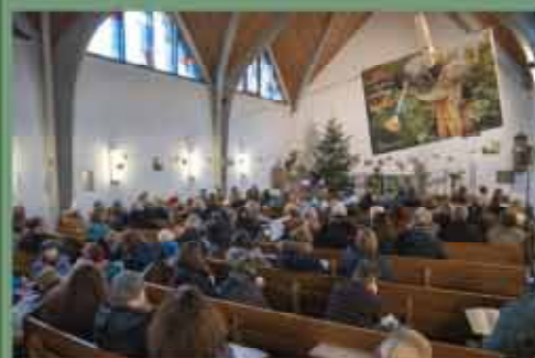
Gottesdienst mit Ehrenamtsdank