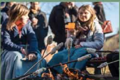
„Bring a Friend“ - Gottesdienst