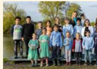
Der Kinderchor des GV Frohsinn Bischberg