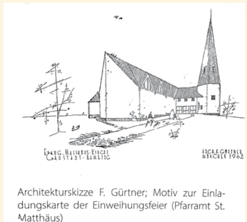
Architekturskizze F. Gürtner; Motiv zur Einladungskarte der Einweihungsfeier (Pfarramt St. Matthäus)